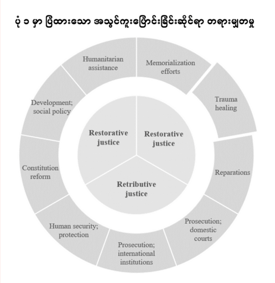
ဤပုံတွင် ကျန်တော်တို့သည် ငြိမ်းချမ်းရေး တည်ဆောက်ခြင်းအတွက် လူမှုဘဝ ပြောင်းလဲတိုးတက်စေဖို့ လိုအပ်သည့်အရာအားလုံးအား ဖြန့်ကျက်စဉ်းစားကာ အဖြေရှာကြပါသည်။

၎င်းသည် ယုံကြည်မှုပိုင်းဆိုင်ရာ စိတ်ထိခိုက်မှုများကို ခံစားနေရသည့်မြန်မာနိုင်ငံ အတွက် အရေးပါပါသည်။ ၂၀၂၁ စက်တင်ဘာနှင့် ဒီဇင်ဘာ လများအတွင်း AAPP မှ မေးမြန်းခဲ့သော လူ ၁၁၀ ယောက်မှ ၄၄ ရာခိုင်နှုန်းသည် စစ်အာဏာရှင်စနစ်နှင့် နောက်ဆက်တွဲ ခြိမ်းခြောက်မှုများအတွက် စိုးရိမ်ပူပန်နေကြောင်း တုံ့ပြန်ခဲ့သည်။ ၎င်း၏နောက်ဆက်တွဲ ပြဿနာများဖြစ်သော ကျန်းမာရေး စောင့်ရှောက်မှု မလုံလောက်မှု၊ ကိုးဗစ်၁၉ ကပ်ဘေး၊ ဝင်ငွေမတည်မြဲခြင်းနှင့် လုပ်ငန်းခွင်မလုံခြုံမှု တို့ကို စိုးရိမ်နေကြသည်။