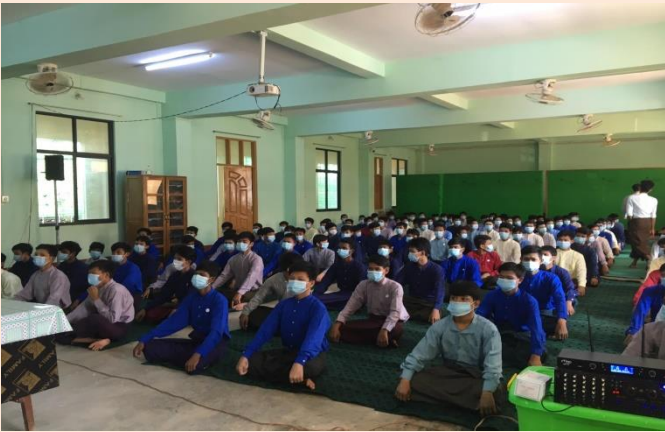
Figure 1 သန်လျင်လူငယ်သင်တန်းကျောင်းရှိ လူငယ်များကို စိတ်ခွန်အားဖြစ်စေမည့် အကြောင်းအရာများကို ဟောပြော