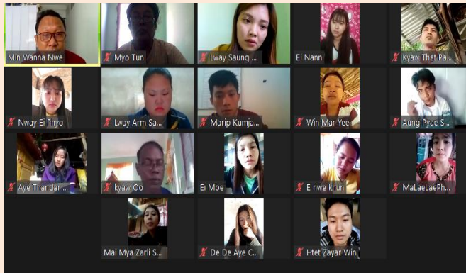
Figure 2 လူ့အခွင့်အရေး၊ လူ့အခွင့်အရေးချိုးဖောက်မှု မှတ်တမ်းတင်ခြင်း၊ ဒစ်ဂျစ်တယ်လိုခြံခြံရေး၊ အသွင်ကူးပြောင်းရေးဆိုင်ရာ တရားမျှတမှု နှင့် တိုင်ကြားမှုယန္တရား သင်တန်းကိုပို့ချ

နိုဝင်ဘာလ 16 ရက်နေ့အထိ အွန်လိုင်းမှတစ်ဆင့် ပို့ချခဲ့သည်။ အဆိုပါသင်တန်းကို သင်တန်းသူ (၈) ဦး နှင့် သင်တန်းသား (၇) ဦး၊ စုစုပေါင်း (၁၅) ဦး တက်ရောက် ခဲ့သည်။