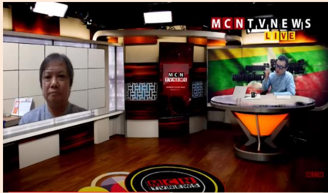
Figure 6 “အမျိုးသားညီညွတ်ရေးအတွက် အဓိကကျသည့် စိန်ခေါ်မှုများ” အစီအစဉ်၌ ပါဝင်ဆွေးနွေး

“အမျိုးသားညီညွတ်ရေးအတွက် အဓိကကျသည့် စိန်ခေါ်မှုများ” တိုက်ရိုက် မေးမြန်းတင်ဆက်ခြင်းအစီအစဉ်၌ ပါဝင်ခြင်း