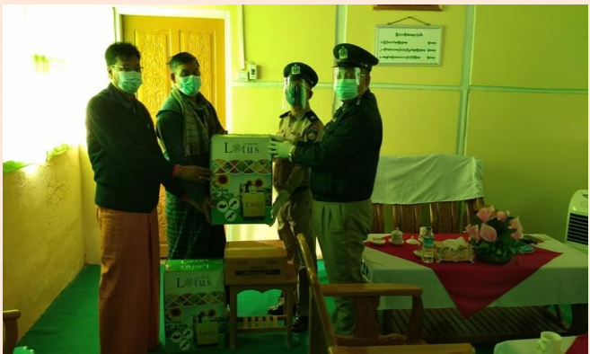
Figure 3 COVID-19 ကာကွယ်ရေးပစ္စည်းများကို အကျဉ်းထောင်များသို့ လှူဒါန်း