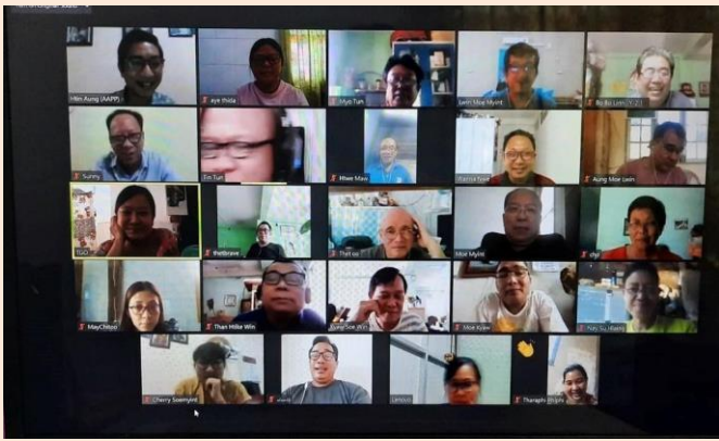
Figure 4 AAPP ဝန်ထမ်းများကို စိတ်ကျန်းမာရေးဆိုင်ရာ အသိပညာပေးမှု ပို့ချခြင်း