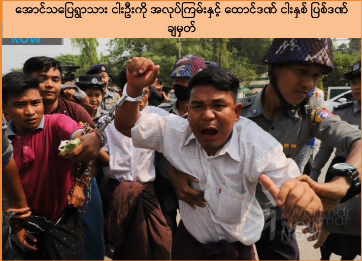
အောင်သပြေရွာသား ငါးဦးကို အလုပ်ကြမ်းနှင့် ထောင်ဒဏ် ငါးနှစ် ပြစ်ဒဏ် ချမှတ်

၂၀၂၀ ခုနှစ်၊ မတ်လကုန်တွင် မြန်မာနိုင်ငံအတွင်း၌ နိုင်ငံရေးလှုပ်ရှားမှုများကြောင့် ဖမ်းဆီး၊ ထိန်းသိမ်းခြင်း ခံထားရသူနှင့် ထောင်ပြင်ပမှ တရားရင်ဆိုင်နေရသူ စုစုပေါင်း 615 ဦးရှိသည်။ ထိုထဲမှ နိုင်ငံရေး အကျဉ်းသား စုစုပေါင်း 92 ဦး အကျဉ်းကျခြင်းခံနေရပြီး တက်ကြွလှုပ်ရှားသူ 124 ဦးသည် ထောင်တွင်းမှနေ၍ တရားရင်ဆိုင်နေရကာ 399 ဦးသည် ထောင်ပြင်ပမှနေ၍ တရားရင်ဆိုင်နေရသည်။