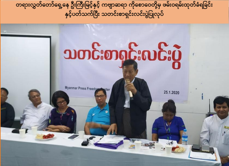
ဓာတ်ပုံ- မြန်မာတိုင်းမ် ၂၀၂၀ ခုနှစ်၊ ဇန်နဝါရီလ

၂၀၂၀ ခုနှစ်၊ ဇန်နဝါရီလကုန်တွင် မြန်မာနိုင်ငံတွင်း၌ နိုင်ငံရေးလှုပ်ရှားမှုများကြောင့် ဖမ်းဆီးထိန်းသိမ်းခြင်း ခံထားရသူနှင့် ထောင်ပြင်ပမှ တရားရင်ဆိုင်နေရသူ စုစုပေါင်း ၆၄၇ ဦးရှိသည်။ ထိုထဲမှ နိုင်ငံရေးအကျဉ်းသား စုစုပေါင်း ၇၃ ဦး အကျဉ်းကျခြင်းခံနေရပြီး တက်ကြွလှုပ်ရှားသူ ၁၄၁ ဦးသည် ထောင်တွင်းမှနေ၍ တရားရင်ဆိုင်နေရကာ ၄၃၃ ဦးသည် ထောင်ပြင်ပ မှနေ၍ တရားရင်ဆိုင်နေရသည်။