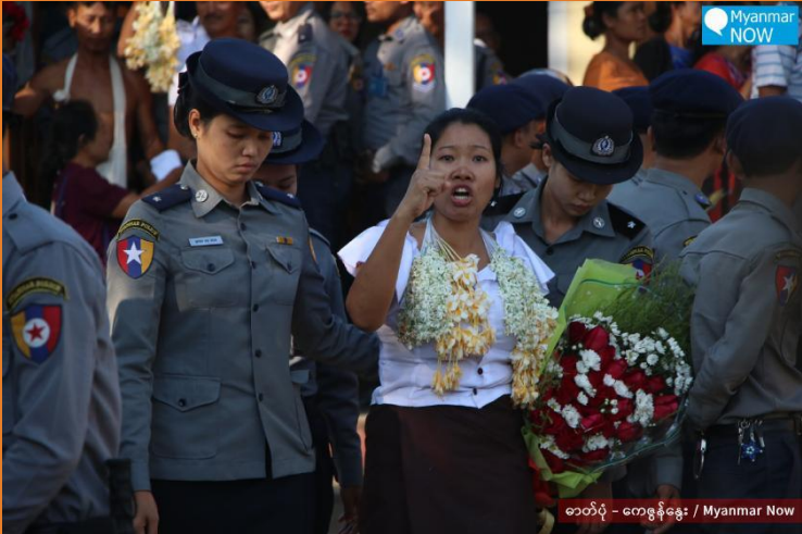
၂၀၁၉ ခုနှစ်၊ ဒီဇင်ဘာလ

၂၀၁၉ ခုနှစ်၊ ဒီဇင်ဘာလကုန်တွင် မြန်မာနိုင်ငံတွင်း၌ နိုင်ငံတွင်း၌ နိုင်ငံရေးလှုပ်ရှားမှုများကြောင့် ဖမ်းဆီး၊ ထိန်းသိမ်းခြင်းခံထားရသူနှင့် ထောင်ပြင်ပမှ တရားရင်ဆိုင်နေရသူ စုစုပေါင်း ၆၃၁ ဦးရှိသည်။ ထိုထဲမှ နိုင်ငံရေး အကျဉ်းသား စုစုပေါင်း ၇၄ ဦး အကျဉ်းကျခြင်း ခံနေရပြီး တက်ကြွလှုပ်ရှားသူ ၃၈၅ ဦးသည် ထောင်တွင်းမှနေ၍ တရားရင်ဆိုင်နေရကာ ၁၇၂ ဦးသည် ထောင်ပြင်ပမှနေ၍ တရားရင်ဆိုင်နေရသည်။