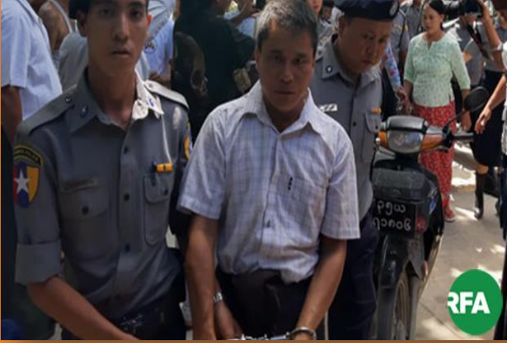
၂၀၁၉ ခုနှစ်၊ ဇူလိုင်လ

၂၀၁၉ ခုနှစ်၊ ဇူလိုင်လကုန်တွင် မြန်မာနိုင်ငံအတွင်း၌ နိုင်ငံရေးလှုပ်ရှားမှုများကြောင့် ဖမ်းဆီး၊ ထိန်းသိမ်းခြင်း ခံထားရသူနှင့် ထောင်ပြင်ပမှ တရားရင်ဆိုင်နေရသူ စုစုပေါင်း ၅၁၃ ဦးရှိသည်။ ထိုထဲမှ နိုင်ငံရေး အကျဉ်းသားစုစုပေါင်း ၄၁ ဦး အကျဉ်းကျခြင်းခံနေရပြီး တက်ကြွလှုပ်ရှားသူ ၁၇၅ ဦးသည် ထောင်တွင်းမှနေ၍ တရားရင်ဆိုင်နေရကာ ၂၉၇ ဦးသည် ထောင်ပြင်ပ မှနေ၍ တရားရင်ဆိုင်နေရသည်။