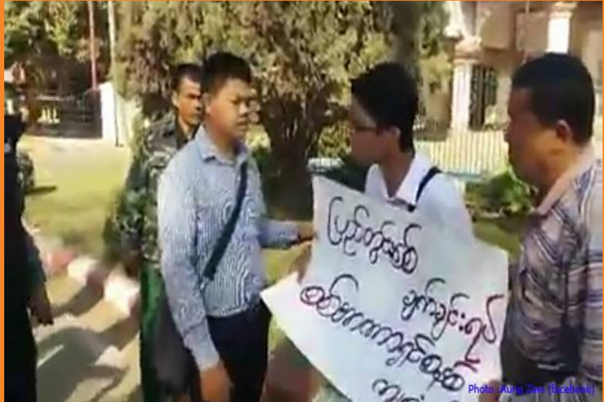
ဓာတ်ပုံ လွတ်လပ်သောအာရှအသံ (RFA) ဖေဖော်ဝါရီလ ၂၀၁၇ ခုနှစ်

၂၀၁၇ ခုနှစ်၊ ဖေဖော်ဝါရီလကုန်ထိ မြန်မာနိုင်ငံ တွင်း နိုင်ငံရေးလှုပ်ရှားမှုများကြောင့် ဖမ်းဆီး ထိန်းသိမ်းခံ ထားရသူ ၂၉၂ ဦးရှိသည်။ ထိုထဲမှ နိုင်ငံရေး အကျဉ်း သား စုစုပေါင်း ၈၆ ဦး အကျဉ်းကျခံနေရပြီး တက်ကြွ လှုပ်ရှားသူ ၈၅ ဦးသည် ထောင်တွင်းမှနေ၍ တရားရင် ဆိုင်နေရကာ ၁၂၁ ဦးသည် ထောင်ပြင်ပမှနေ၍ တရား ရင်ဆိုင်နေရသည်။