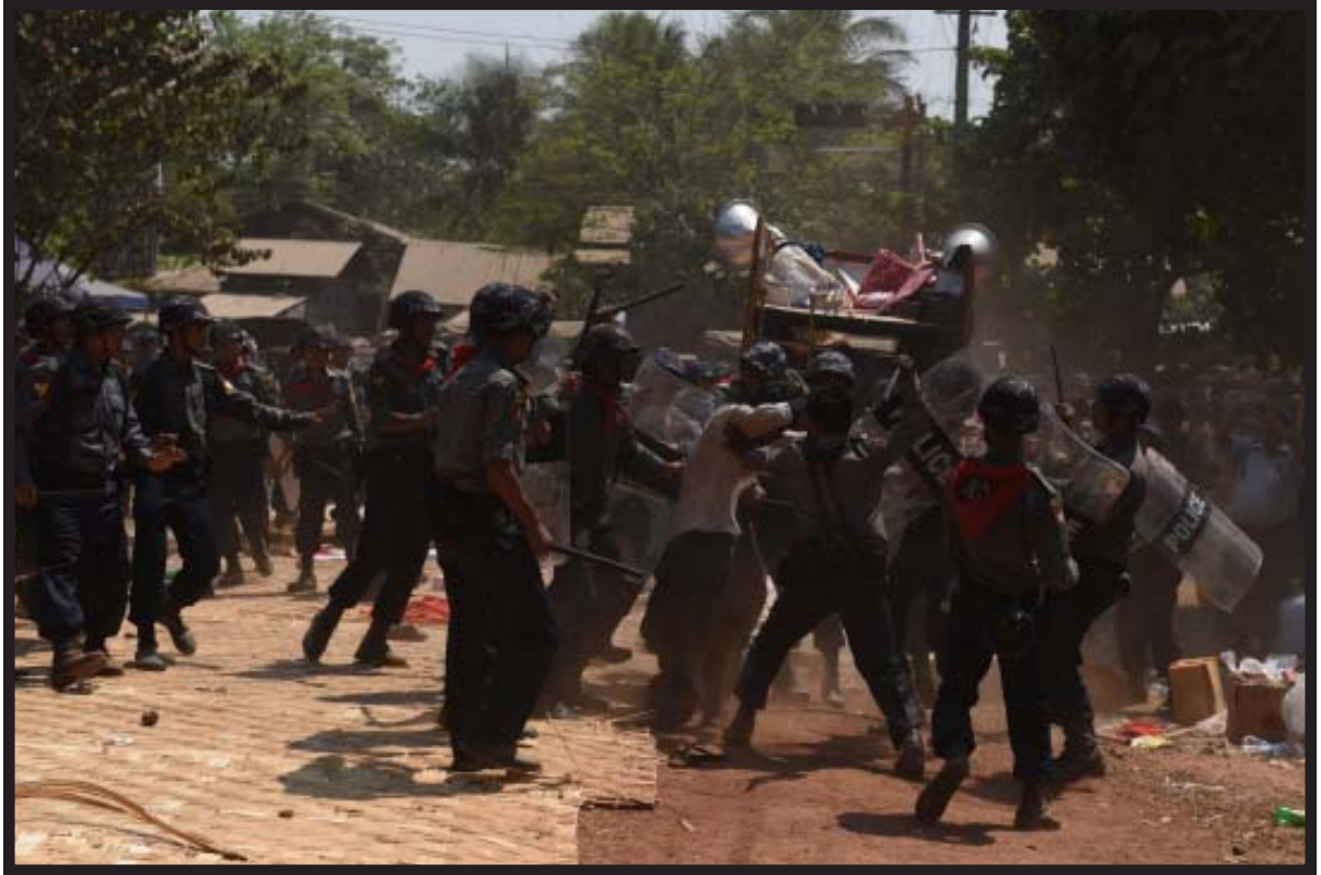
၂၀၁၅ ခုနှစ် မတ်လ ၁၀ ရက်နေ့ လက်ပံတန်းမြို့တွင် ရဲများမှ ကျောင်းသားတစ်ဦးအား ရိုက်နှက်ဖမ်းဆီးနေစဉ်

အစီရင်ခံစာ၏ အပိုင်း (၁) ဖြစ်သော နိဒါန်းပိုင်းတွင် မြန်မာနိုင်ငံမှ HRD များ ကြုံတွေ့ရသည့်ကိစ္စရပ်များ၏ နောက်ခံသမိုင်းကြောင်းကို ရှင်းပြထားပြီး တိုင်းပြည်၏ လက်ရှိနိုင်ငံရေးအခြေအနေကို ဖော်ပြထားသည်။ အကျဉ်းပြောရလျှင် သမ္မတဦးသိန်းစိန်၏ အရပ်သားတစ်ပိုင်းအစိုးရ အာဏာရလာသည့် ၂၀၁၁ ခုနှစ် အစောပိုင်းမှစ၍ မြန်မာနိုင်ငံသည် ပြုပြင်ပြောင်းလဲမှုများစွာကို ဖြတ်သန်းခဲ့ရာ HRD များ၏အခြေအနေ တိုးတက်လာမည်ဟု လူအများမျှော်လင့်ခဲ့ကြသည်။ ၎င်းတို့အနေဖြင့် တန်ဖိုးရှိပြီး တရားဝင်မှုရှိသော လူ့အခွင့်အရေးအလုပ်ကို လွတ်လပ်စွာလုပ်ဆောင်ခွင့် ရလိမ့်မည်ဟု မျှော်လင့်ခဲ့ကြသည်။ သို့သော်လည်း ပြည်တွင်းမှ ထွက်ဆိုချက်များနှင့် အစီရင်ခံစာများက အလွန်တရာကွဲပြားသော မြင်ကွင်းကို ပြနေရာ ၂၀၁၅ ခုနှစ် နိုင်ငံလုံးဆိုင်ရာ ရွေးကောက်ပွဲများ နီးသထက်နီးလာချိန်တွင် HRD များ လှုပ်ရှားနိုင်သည့် ဒီမိုကရေစီနယ်ပယ်၊ အရပ်ဖက်အသိုင်းအဝိုင်းနယ်ပယ်မှာ ထိတ်လန့်စရာကောင်းလောက်အောင် ပြန်လည်ကျဉ်းမြောင်းလာ နေသည်။ ယခုအခါ လူ့အခွင့်အရေးများကို ကာကွယ်စောင့်ရှောက်ရန် ကြိုးစားသူများသည် ယခင်ကလိုပင် အန္တရာယ်များသည့် ပတ်ဝန်းကျင်၌ လှုပ်ရှားနေကြရဆဲဖြစ်သည်။