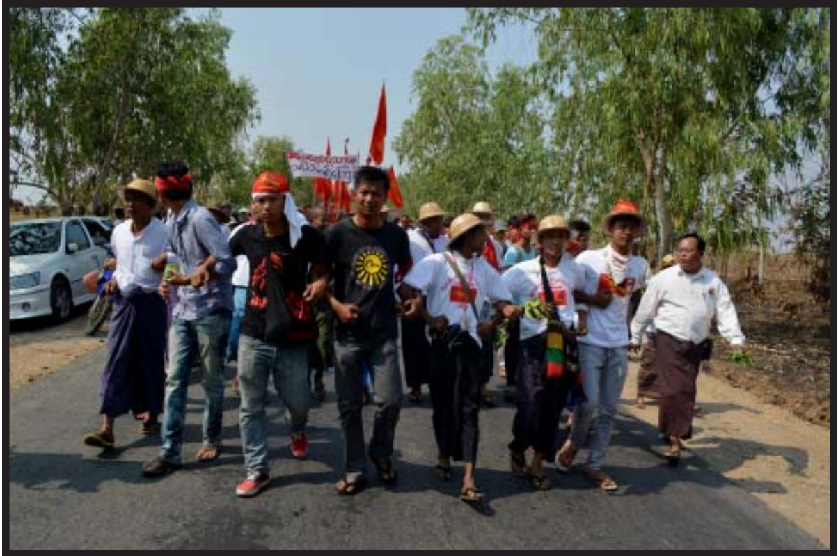
ပဲခူးတိုင်းနှင့် မကွေးတိုင်းများတွင် အမျိုးသားပညာရေးဥပဒေအား ဆန့်ကျင်ဆန္ဒပြနေသည့် ကျောင်းသားများ

တာက ဘဏ္ဍာရေးအနှောင်အဖွဲ့တွေ၊ ကျနော်မှာ ဝင်ငွေ အလေးထားရှာဖို့ အချိန်သိပ်မရဘူး။”