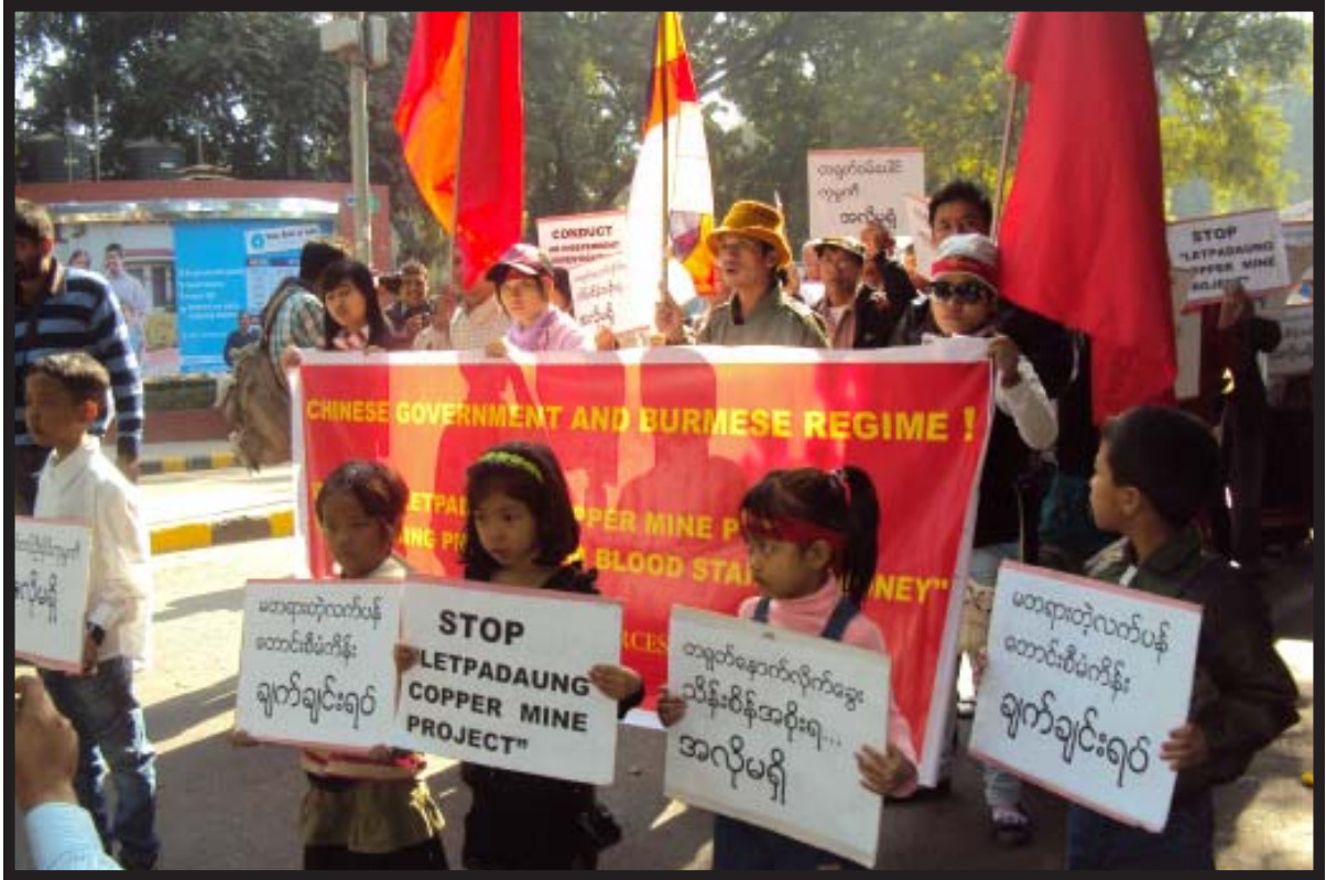
လက်ပံတောင်းတောင် ကြေးနီစီမံကိန်းအား ဆန့်ကျင်ဆန္ဒပြနေစဉ်

တရားစွဲမှုများ ပိုမိုလုပ်ဆောင်လာသည်ကို သတိပြုရန် အရေးကြီးသည်။ ဤသို့ HRD များကို “ရာဇဝတ်သားများ” အဖြစ် တံဆိပ်အသစ်ကပ်ခြင်းအားဖြင့် နိုင်ငံတကာအသိုင်းအဝိုင်း၏ ပြစ်တင်ရှုံ့ချမှုကို ရှောင်လွှဲနိုင်ရန် မျှော်လင့်နေသည်။